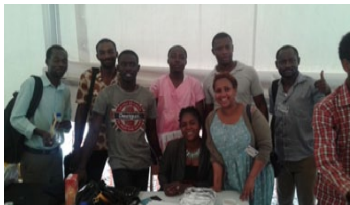
L'équipe ivoirienne au Liberia