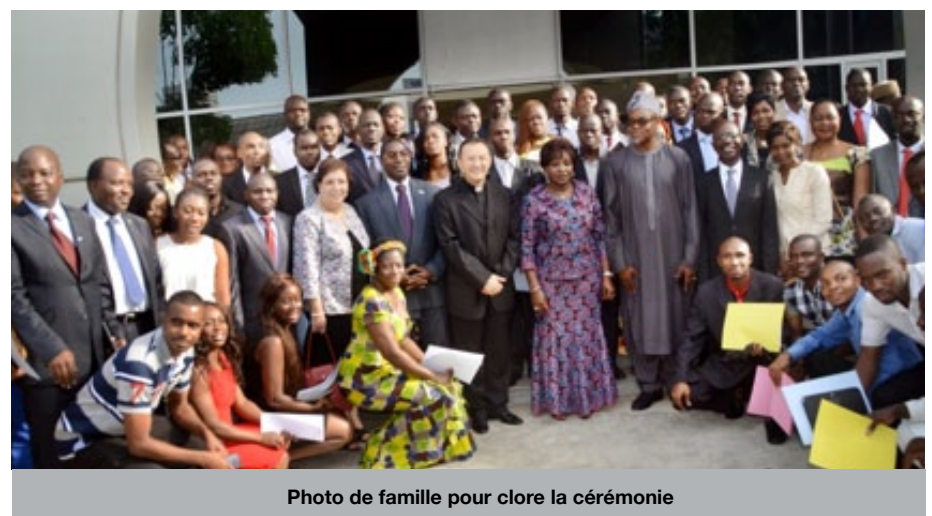
Photo de famille pour clore la cérémonie

Remontez-nous toutes les informations en écrivant à info@cicg.gouv.ci ou appelez le 20 31 28 28