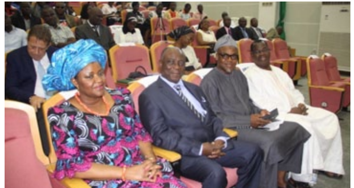
La ministre de la Santé et de la Lutte contre le Sida, était pour la circonstance accompagnée d'un parterre de personnalités