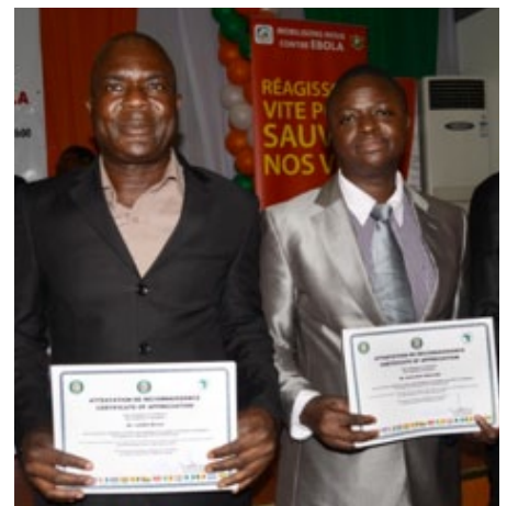
Les personnalités présentes ont remis deux certificats, un pour la formation au Ghana...