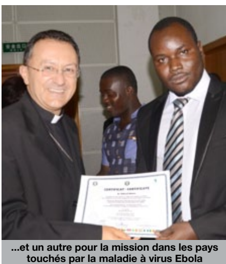
...et un autre pour la mission dans les pays touchés par la maladie à virus Ebola