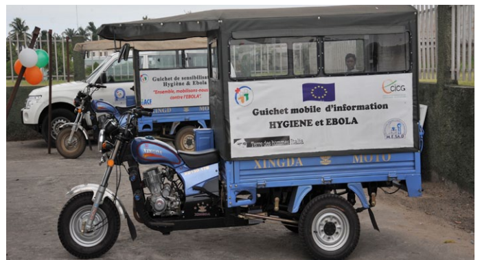
Les ONGs ACF, ACTED et Terre des Hommes...