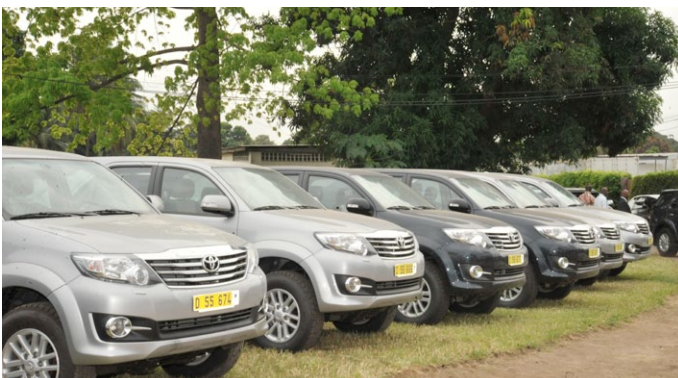
Vue de véhicules offerts par l'UE