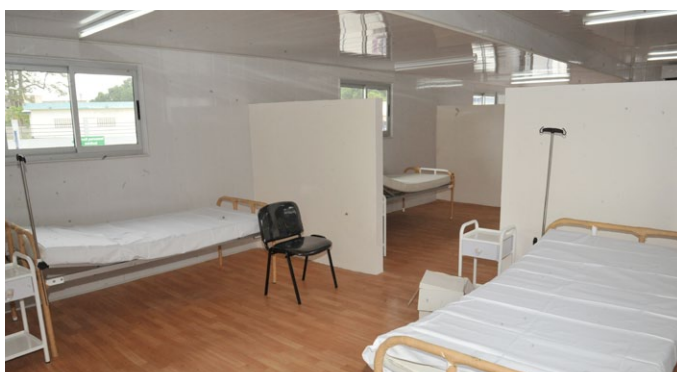
la zone d'observation