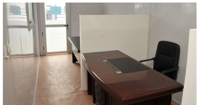
La zone du personnel médical