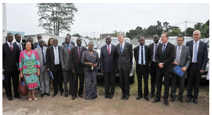
Photo de famille pour immortaliser l'événement

Remontez-nous toutes les informations en écrivant à info@cicg.gouv.ci ou appelez le 20 31 28 28