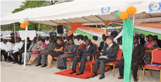
Plusieurs personnalités ont pris part à la cérémonie