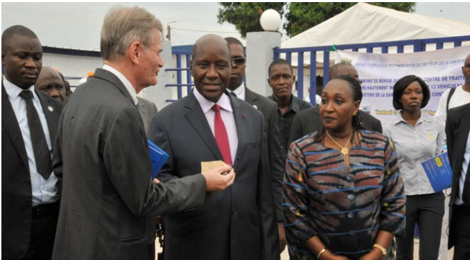
Remise par l'Ambassadeur de l'UE de 13 véhicules d'une valeur de 250 millions de FCFA au Gouvernement