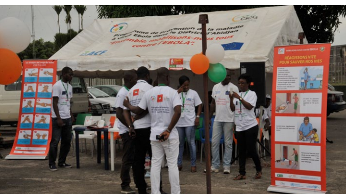
... étaient également présentes avec un stand de sensibilisation.