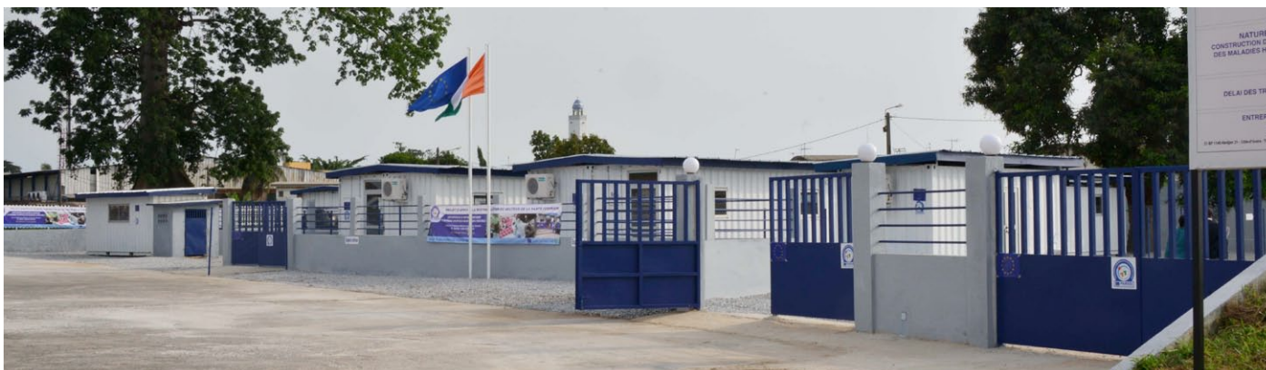
Vue du CTE de Treichville