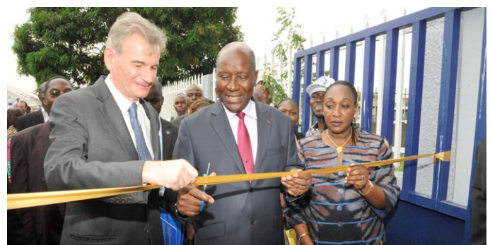
Coupure du ruban suivie de ....