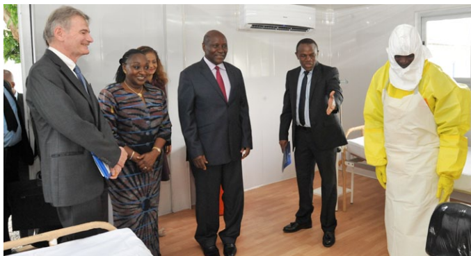
...la visite du CTE