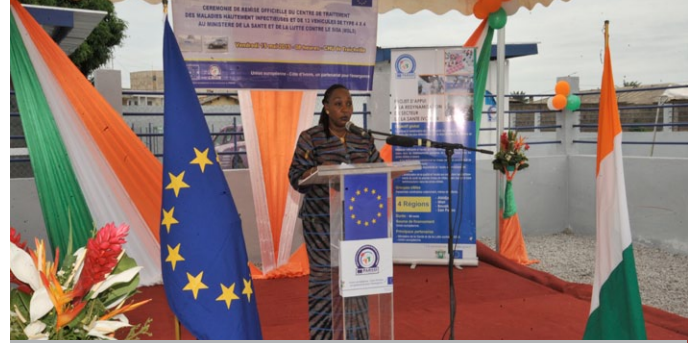
la Ministre de la Santé pendant son allocution