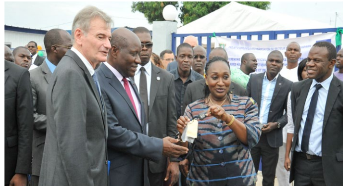
le Premier Ministre a remis les clefs au Ministre de la Santé et de la Lutte contre le SIDA